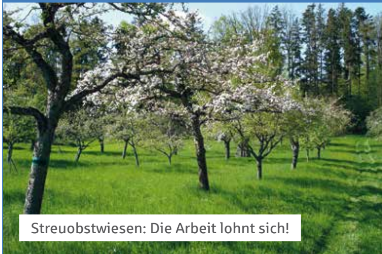
Streuobstwiesen: Die Arbeit lohnt sich!