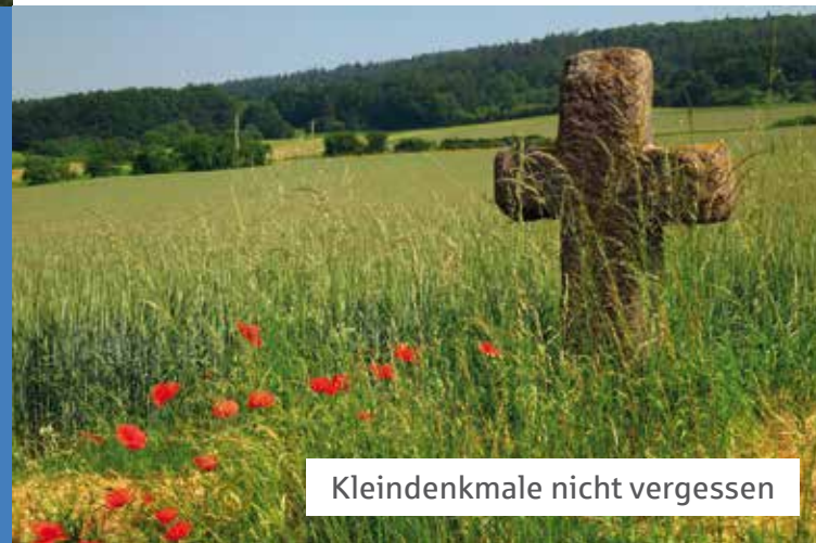
Kleindenkmale nicht vergessen

Angesprochen ist, wer sich um Kleindenkmale kümmert, wer sie schützt, renoviert und pflegt, wer eines vor dem Untergang rettet, wer sich ihrer Kulturge-