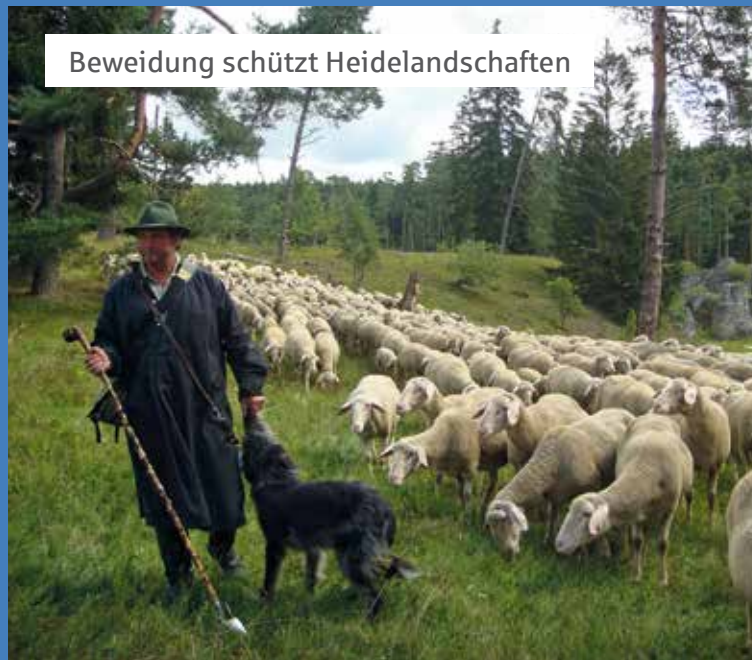
Beweidung schützt Heidelandschaften