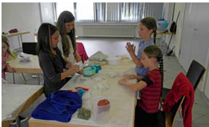
Filzen von Armbändern oder Schlüsselanhängern

Durch ihr Engagement konnte über die ganze Ferienzeit wieder ein tolles und abwechslungsreiches Programm angeboten werden.