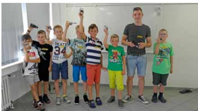
Elektrorennwagen mit Solarantrieb