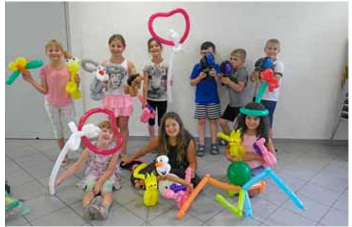
Lustige Luftballonfiguren selbst gemacht