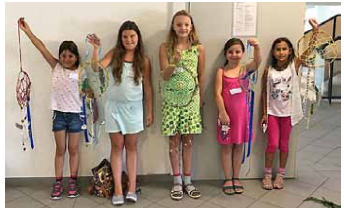
Traumfänger - nie mehr schlechte Träume