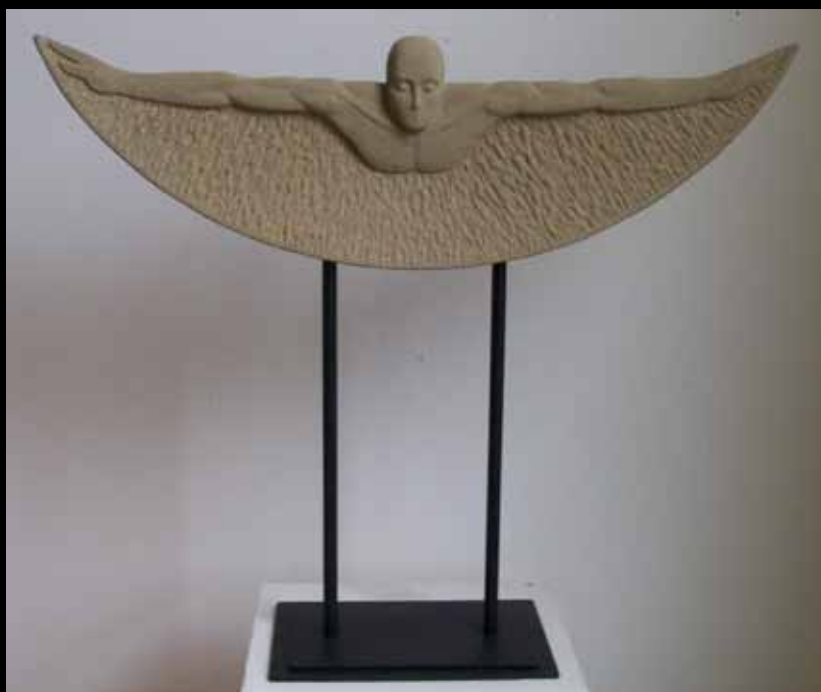
Traumflug II, 2010