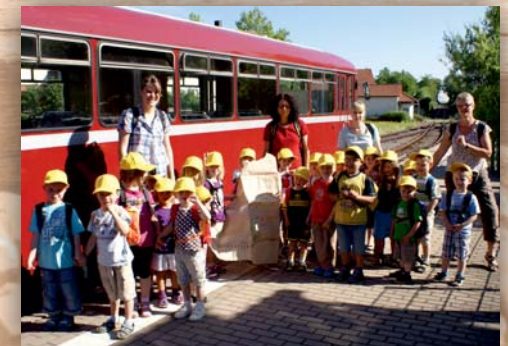
Kindergartenausflug mit der Krebsbachtalbahn

Die Fahrten auf der Krebsbachtalbahn werden von der Pfalzbahn GmbH durchgeführt. Für 2012 ist der Einsatz eines Esslinger Triebwagens geplant.