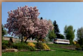
Frühling im Krebsbachtal

Die Fahrten auf der Krebsbachtalbahn werden von der Pfalzbahn GmbH durchgeführt. Für 2012 ist der Einsatz eines Esslinger Triebwagens geplant.