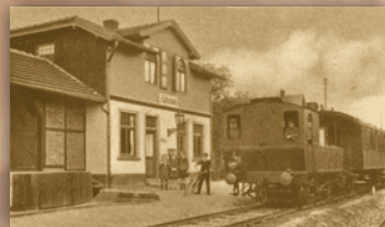
Zug am Bahnhof Hüffenhardt