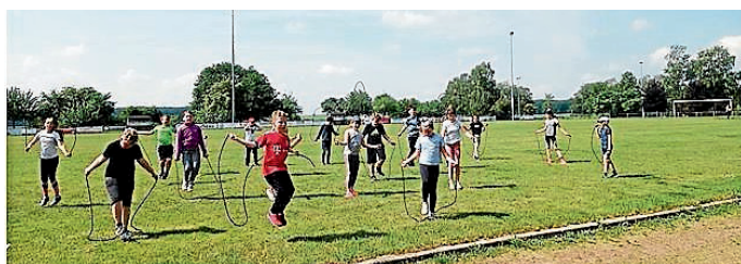
Die Kinder hatten sehr viel Spaß mit den neuen Sportgeräten