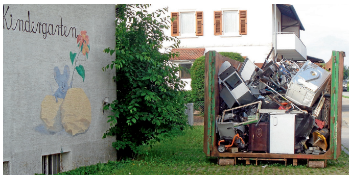
Der Container füllt sich

Im Namen unserer Kinder und des Erzieherenteams ein herzliches Dankeschön. Dieser Dank geht an alle Spender, alle Helfer und an alle, die sich mit uns verbunden fühlen und uns unterstützen.