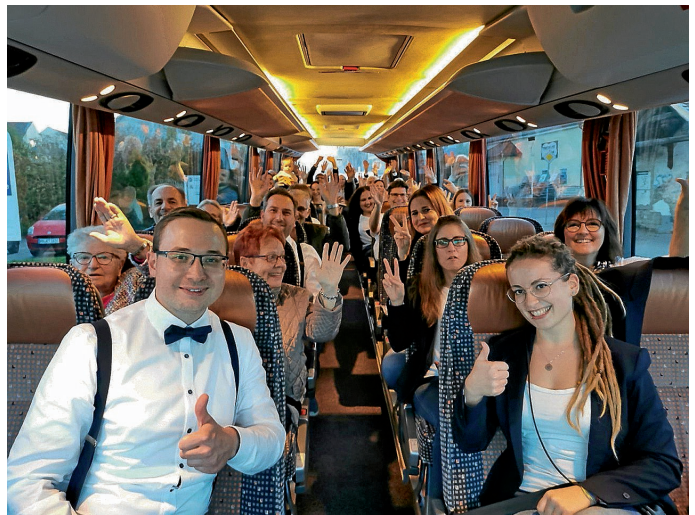
Gute Stimmung im Bus nach Sulzbach

Maierhofer), „I'll be there“ (von den Jackson 5) und dem Evergreen „Country Roads“. Später sangen wir zusammen mit mehreren Chören mit vereinter Stimme den „Wellerman“ als glänzendes Finale des Abends. Es war eine tolle Auftrittsnacht, die wir nach der langen Coronapause wirklich herbeigesehnt haben. Nun freuen wir uns umso mehr auf unser Konzert im Siegelbacher BÜZ am 19. November 2022, wozu wir euch jetzt schon ganz herzlich einladen.