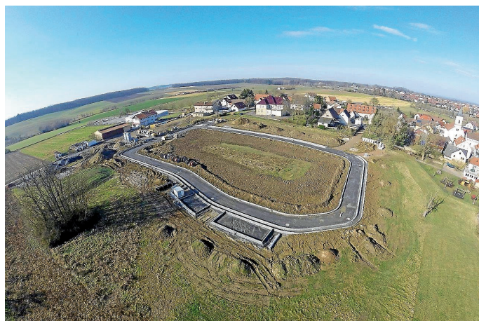
Baugebiet „Hinter der alten Schule“

Die Vergaberichtlinien und alle weiteren Informationen können auf der Homepage www.baupilot.com/siegelsbach abgerufen werden.