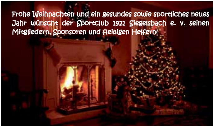
Frohe Weihnachten und ein gesundes sowie sportliches neues Jahr wünscht der Sportclub 1921 Siegelbach e. V. seinen Mitgliedern, Sponsoren und fleißigen Helfern!

Die Gemeindeverwaltung bleibt an folgenden Tagen geschlossen: Mittwoch, 24.12.2014 (Heiligabend) Mittwoch, 31.12.2014 (Silvester) Freitag, 2.1.2015 (Brückentag) und Montag, 5.1.2015 (Brückentag) An den übrigen Tagen ist das Bürgerbüro zu den üblichen Sprechzeiten geöffnet. In dringenden standesamtlichen Angelegenheiten wenden Sie sich bitte an den Brückentagen (2.1.2015 und 5.1.2015) zwischen 9.00 und 11.00 Uhr an die Mitarbeiterinnen des Standesamtes. Diese sind zu erreichen unter der Telefonnummer 07264/9150-25. Wir bitten um Beachtung.