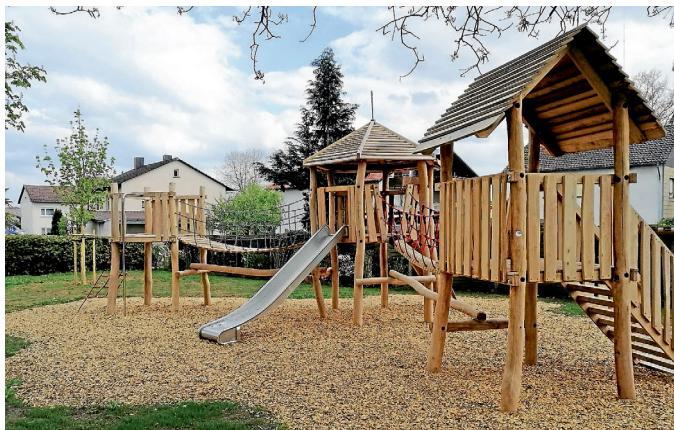
Spielplatz im Mai 2021

Die Siegelsbacher Kinder haben lange genug gewartet und jetzt ist es so weit: Der Spielplatz in der Schubertstraße öffnet nach dem Umbau endlich wieder seine Pforten. Ab Samstag, 22.5.2021 ist der Spielplatz für die Öffentlichkeit freigegeben und die neuen Geräte dürfen ausprobiert und bespielt werden. Wir bitten jedoch zu beachten, dass nach wie vor eine Zutrittsbeschränkung von 15 Personen gilt. Die Eltern sind in der Verantwortung, diese Regel einzuhalten. Nur so kann der Spielplatz in der aktuellen Situation dauerhaft geöffnet bleiben. Die Gemeindeverwaltung dankt recht herzlich für die Unterstützung.