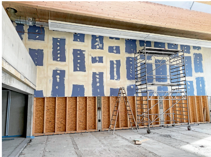
Baufortschritt beim Innenausbau Mai 2021

Derzeit finden vorbereitende Maßnahmen für die weiteren Innenausbauarbeiten statt. Im Anschluss folgen Malerarbeiten, Fliesenarbeiten, Deckenbau, Sportgeräte, Prallwände usw.