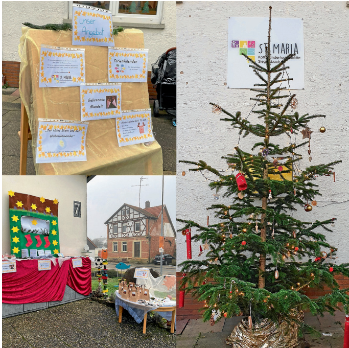
Unser Weihnachtsmarkt für die Familien

Auch unseren Eltern wollten wir ein kleines Weihnachtsmarkterlebnis nicht vorenthalten und so gab es die Möglichkeit zwischen 13.30 und 15.30 Uhr vor der Kita ein wenig zu stöbern. Die Familien fanden hier einen Weihnachtsferienkalender mit lustigen, kreativen und vielfältigen Anregungen für die freie Zeit. Das Bilderbuch der Kinder, Lebkuchen und gebrannte Mandeln sowie eine Rentierüberraschungstüte konnte gegen eine Spende mit nach Hause genommen werden. So war es uns möglich auch in dieser Zeit ein wenig Weihnachtsmarktstimmung einzufangen und wir freuen uns bereits auf das kommende Jahr und hoffen darauf, wieder gemeinsam mit Ihnen „Marias Winterdorf“ erleben zu können.