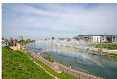
Buga 2019 - ein Ausflugsziel ganz in der Nähe

Die Landfrauen Siegelsbach möchten alle Interessierten zu einem Ausflug auf die Bundesgartenschau 2019 einladen. Direkt vor unserer Haustür, mit dem Zug erreichbar, findet diese in diesem Jahr in Heilbronn statt und jeder, der bisher dort war ist begeistert von der Atmosphäre, den Erlebnissen und der Verschönerung der Stadt durch die Buga.