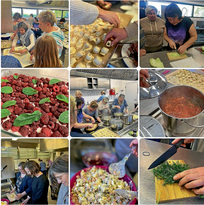
LandFrauen kochen russische Gerichte