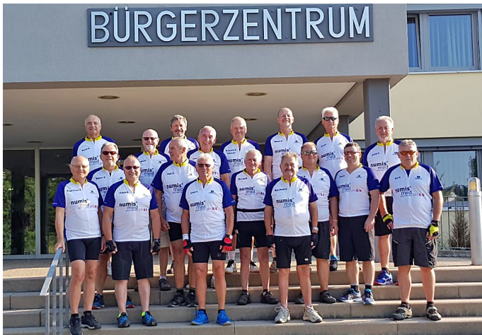
AH-Mitglieder 2018 vor unserem Radausflug ins Zabergäu

Die Abteilung AH besteht zurzeit aus 41 Mitgliedern. Viele davon sind ehemalige Fußballer und darin hat auch die AH-Abteilung ihren Ursprung. Zwischenzeitlich liegt der Schwerpunkt unserer sportlichen Aktivitäten in den Sommermonaten beim Radfahren und im Herbst und Winter auf der Gymnastik in der Sporthalle. Dadurch haben auch Sportler zu uns gefunden, die bisher nichts mit Fußball zu tun hatten. Diese Mischung und die relativ große Altersbandbreite der aktiven Mitglieder machen unsere Abteilung auch für Neueinsteiger sehr interessant. Es sind praktisch keinerlei besonderen Begabungen Voraussetzung um bei uns einzusteigen. Wichtig ist, dass man sich in einer Gemeinschaft wohlfühlt und Kameradschaft über den sportlichen Ehrgeiz stellen kann.