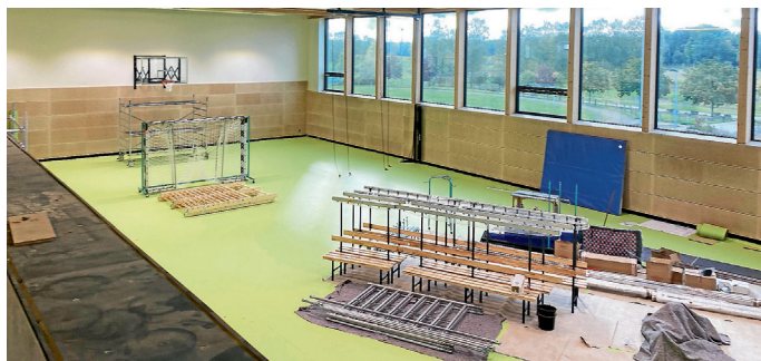
Lieferung und Montage der Sportgeräte und der Sitzbänke in der Umkleide