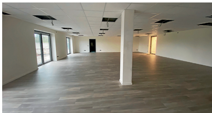
Verlegung Bodenbelag Clubraum Untergeschoss