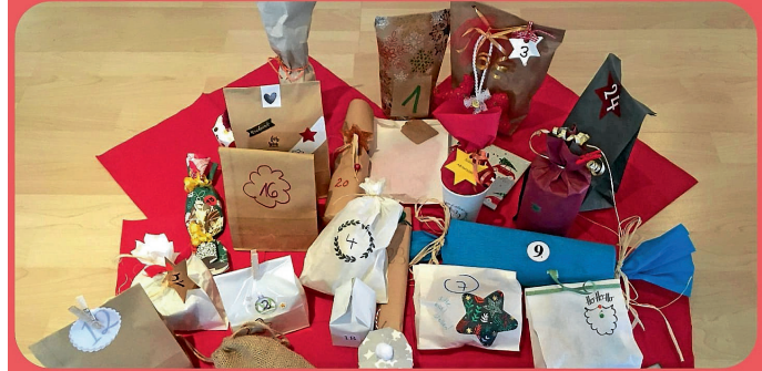
So sah das Ganze letztes Jahr aus