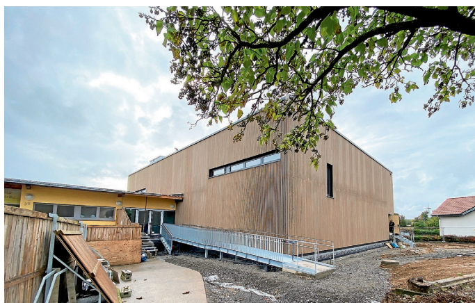
Stellung der Außenrampe und Notausgangstreppe