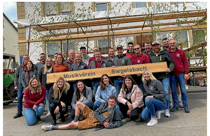
Traditionsgemäß letzter Halt: Gasthaus zur Eisenbahn

Schon seit 60 bis 65 Jahren gibt es in Siegelbach die Tradition des Mai-Weckens: Ab 6.00 Uhr morgens rollt am 1. Mai jährlich der Musikverein Siegelbach mit Traktor und Blasmusik durch den Ort und sorgt dafür, dass die Siegelbacher den „Tag der Arbeit“ nicht verschlafen, getreu dem Motto: „Heraus zum ersten Mai!“