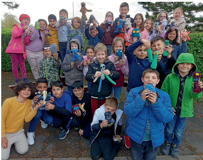
Klasse 3 und 4 mit ihren „Sorgenfresserchen“

Die Astrid-Lindgren-Schule möchte sich hiermit ganz herzlich für die gespendeten Stoffe bedanken. Die bunten, kindgerechten Stoffreste kamen richtig gut an und haben für eine hohe Motivation und Kreativität gesorgt. Die Klassen 3 und 4 haben mit Begeisterung daraus „Sorgenfresserchen“ genäht, was Sie auch im Bild gut sehen können. Vielen Dank für Ihre Unterstützung.