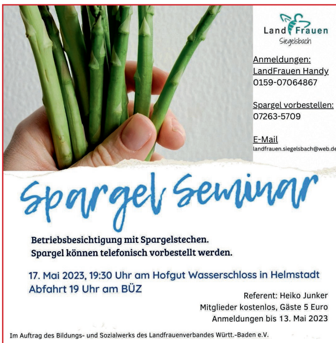
LandFrauen läuten Spargelzeit ein