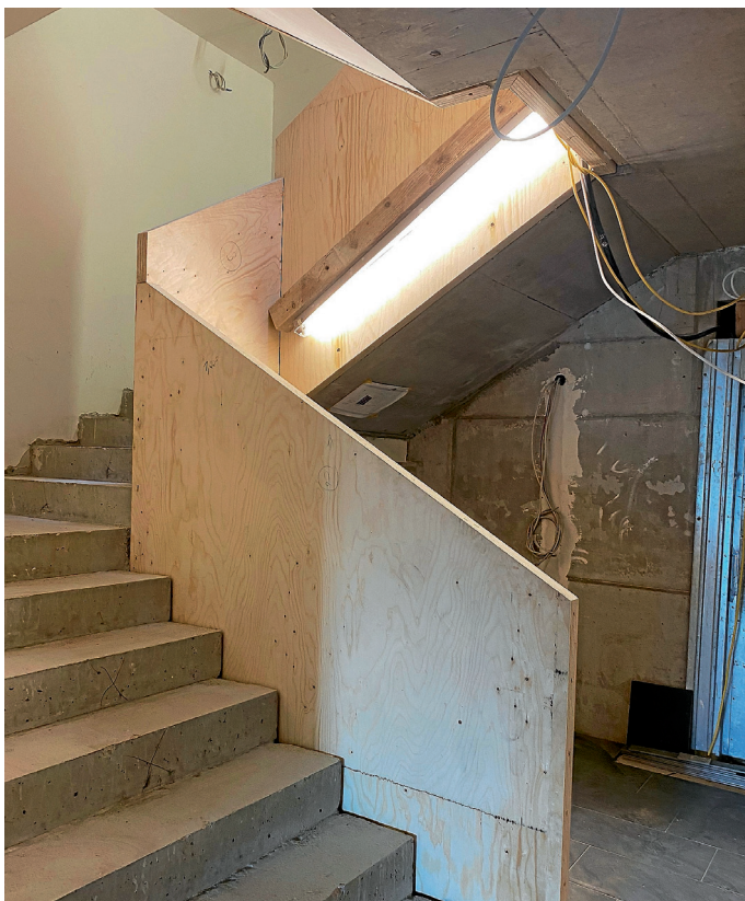
Treppenbrüstung Treppenhaus Fotos: Neuhäuser Architekten