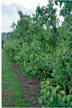
Birnen, potenziell gefährdete Baumart für den Feuerbrand