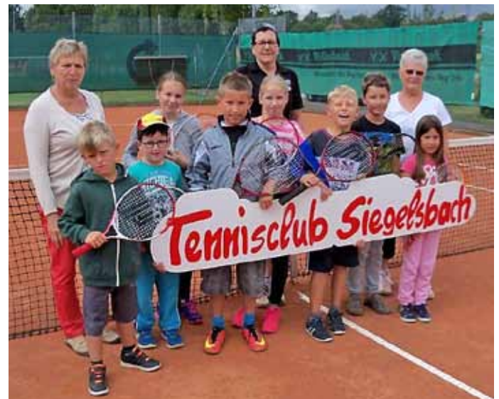
Die Teilnehmer am Ferienprogramm

Natürlich kam auch die Verpflegung nicht zu kurz. Die Teilnehmer konnten sich mit Getränken und selbst gebackenem Kuchen stärken. Nach der Pause ging es auf dem roten Sand weiter und der Nachmittag verging wie im Flug.