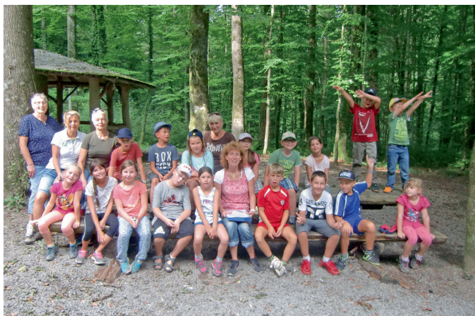
Gruppenbild der Schnitzeljagd

Es war wirklich ein lustiger interessanter Nachmittag für alle Teilnehmer. Hier noch einmal ein herzliches Dankeschön an alle Helfer.