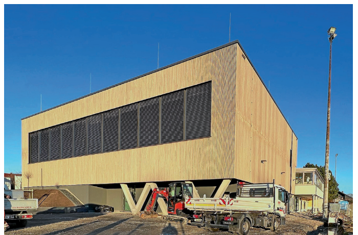
Baustelle an der Sporthalle

Die Gipsarbeiten im UG sind abgeschlossen. Es wird an der Unterkonstruktion für die Abhangdecken gearbeitet und Fliesenarbeiten können in Teilbereichen beginnen. Bei der Außenanlage wird die Pflasterbelegung für nächste Woche vorbereitet.