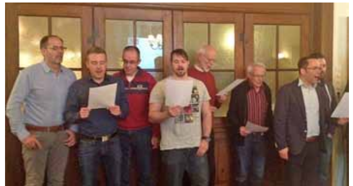
Sänger beim Eröffnungslied „Sängerspruch“

des 4. Grand Prix der Popchöre hingewiesen. Der Mosbacher Chor hatte den für den 7.3. angesetzten Grand Prix auf voraussichtlich Oktober verschoben, sodass nun eine Teilnahme an der Chorparty in Hüffenhardt möglich wird. Diese Teilnahme mit Bandbegleitung will der MGV für Sängerverbung im Rahmen eines Projektchores nutzen. Ein Ausflug im Sommer wird ebenfalls geplant. Tobias Budai beendete die Generalversammlung und wünschte den Sängerinnen und Sängern ein erfolgreiches Jahr 2015.