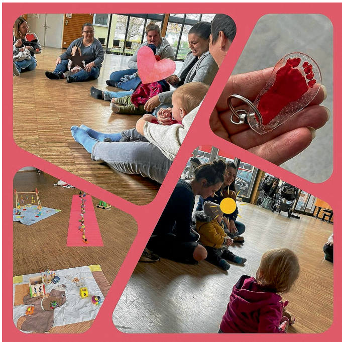
Impressionen der LandMäuse

Die Gruppe trifft sich jeden Montag um 9.30 Uhr im großen Saal im Bürgerzentrum in Siegelsbach. In den Ferien gibt es auch vereinzelt Termine in der Sporthalle. Wer Interesse hat, darf sich gerne über das LandFrauenhandy melden oder kommt montags einfach mal vorbei. Die Gruppe ist nicht nur für LandFrauenmitglieder, sondern auch für andere Mamas und Papas offen – gerne auch aus Nachbarorten.