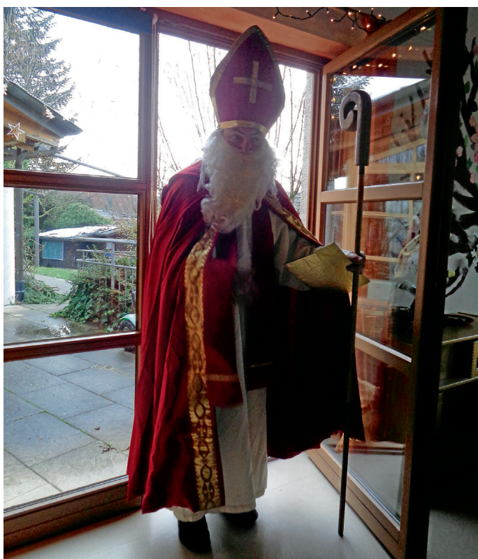
Danke lieber Nikolaus

Die Kinder und Erzieherinnen der Kath. KiTa St. Maria